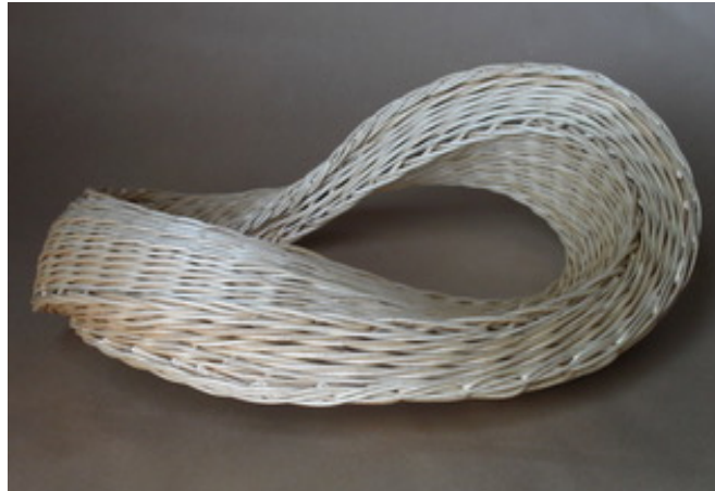
Objekt von Tony Bucheli, Langenthal

Auf 50 m 2 sind gegen 600 Exponate ausgestellt.